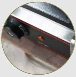
Función de control de temperatura