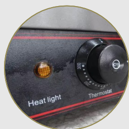
Luz indicadora de encendido