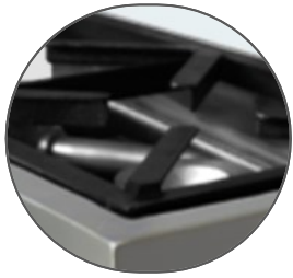
Parrillas y quemadores de alta calidad