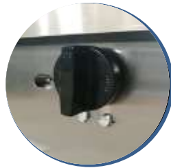
Perillas americanas importadas