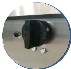
Perillas americanas importadas