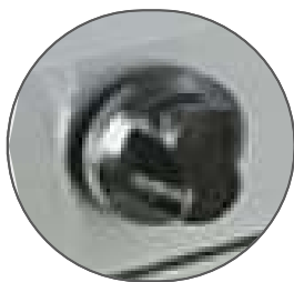
Perillas americanas importadas