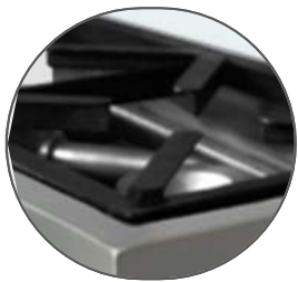
Parrillas y quemadores de alta calidad