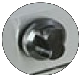
Perillas americanas importadas