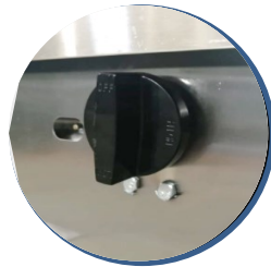
Perillas americanas importadas