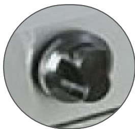
Perillas americanas importadas