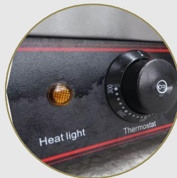
Luz indicadora de encendido