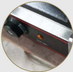
Función de control de temperatura