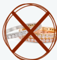
Plata y Oro