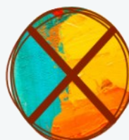
Superficies laqueadas o pintadas