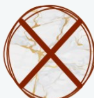
Mármol o Granito pulido