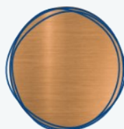
Latón, bronce, cobre