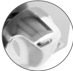
Perillas de lujo americanas importadas