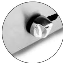
Perillas de lujo americanas importadas