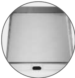
Plancha pulida con Un espesor de 3/4"