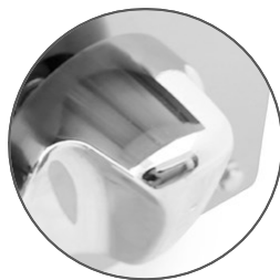
Perillas de lujo americanas importadas